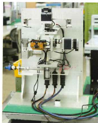
自律走行ロボットに搭載する予定の 自動消火ロボット試作品