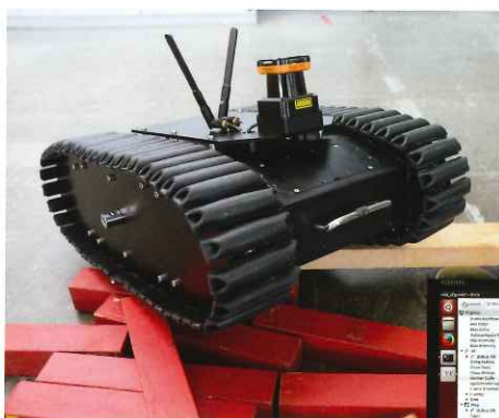
センターが開発した自律走行ロボット